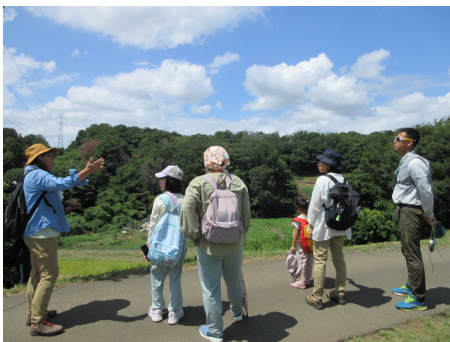
ナラ枯れの様子を確認