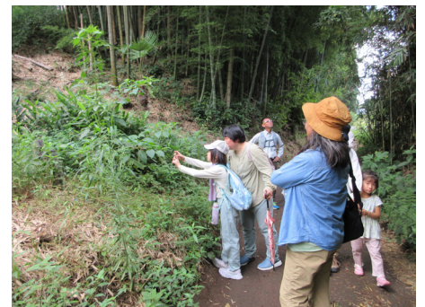
様々な植物を発見。専門家から名前や特徴を聞く